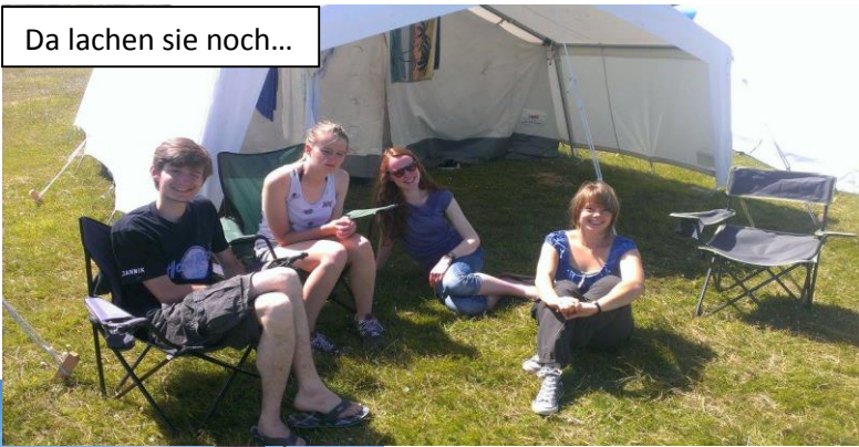
Da lachen sie noch...

Auch in den anderen Dörfern war die gute Laune auch schon aus der Ferne zu erkennen oder, wie im roten Dorf, beim SingStar spielen zu hören.